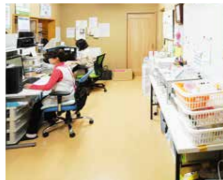
萌気園浦佐ヘルパーステーション